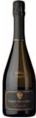
Lessini Doc Durello Spumante Brut 2007