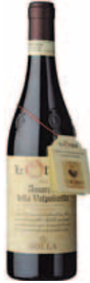
Amarone della Valpolicella Doc Classico "Le Origini" 2006 Bolla